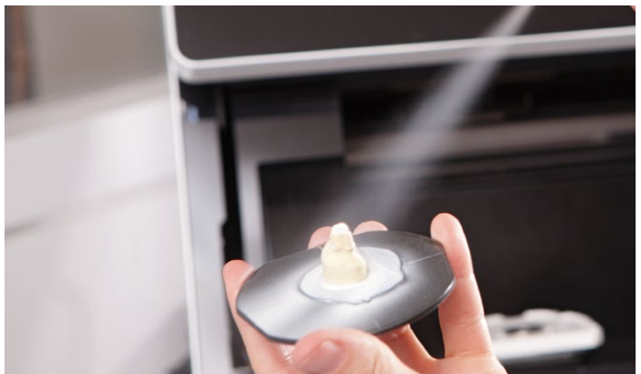
Homogener Schichtauftrag für detailgenaue Scanergebnisse