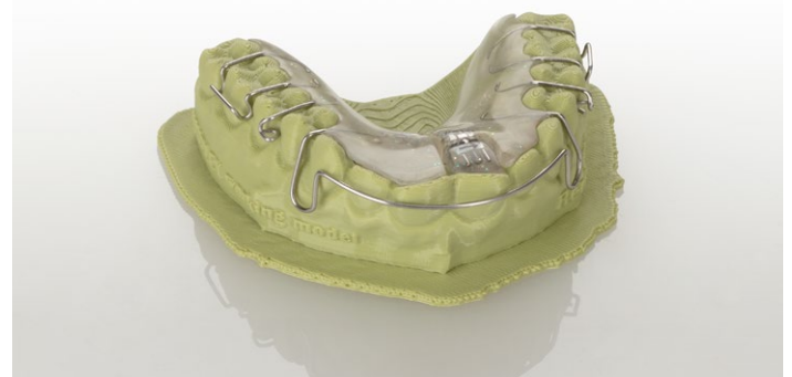
El modelo se puede utilizar de manera habitual, sin ningún tratamiento posterior