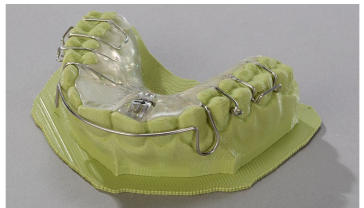
El modelo se puede utilizar de manera habitual, sin tratamiento posterior