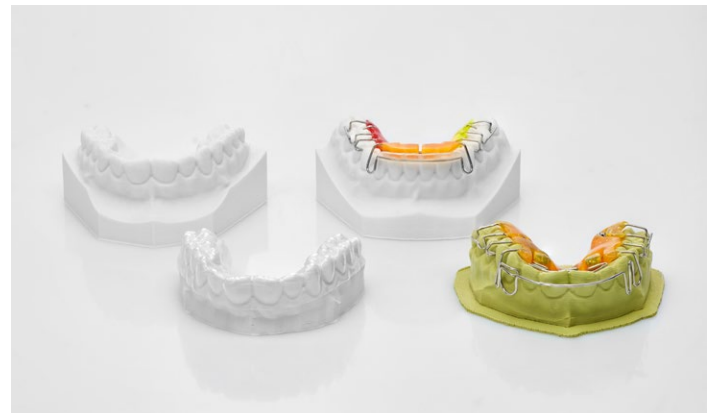
Diseñado para toda la confección de modelos en el campo de la ortodoncia