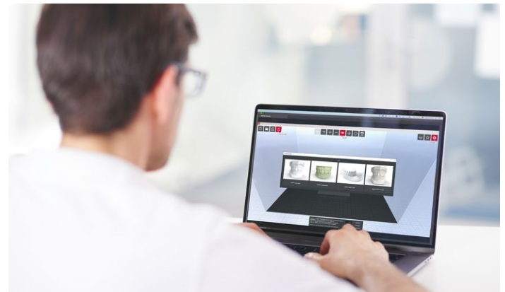
SIMPLEX sliceware mit vorinstallierten Presets für den KFO-Bereich