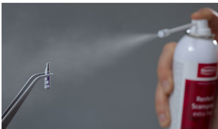
Application microfine pour un résultat de scannage détaillé